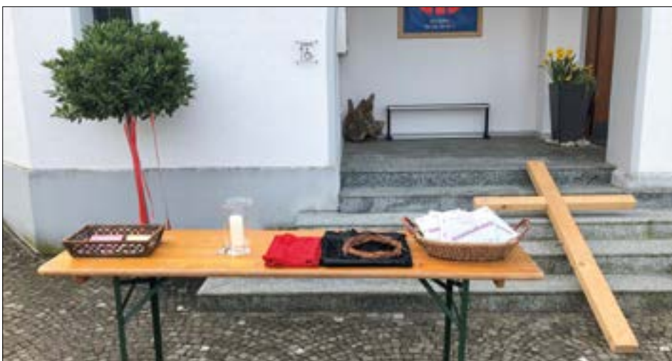
Der Familienkreuzweg startet am Karfreitagmorgen um 10 Uhr auf dem Vorplatz der Kirche.

Karfreitag, 18. April, 10 Uhr: Familienkreuzweg in fünf Stationen durch das Dorf. Treffpunkt vor der Pfarrkirche.