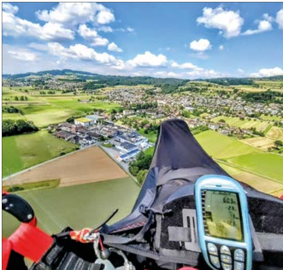
Anflug mit dem Gleitschirm auf Geuensee nach Thermikflug mit Start bei Herlisberg.