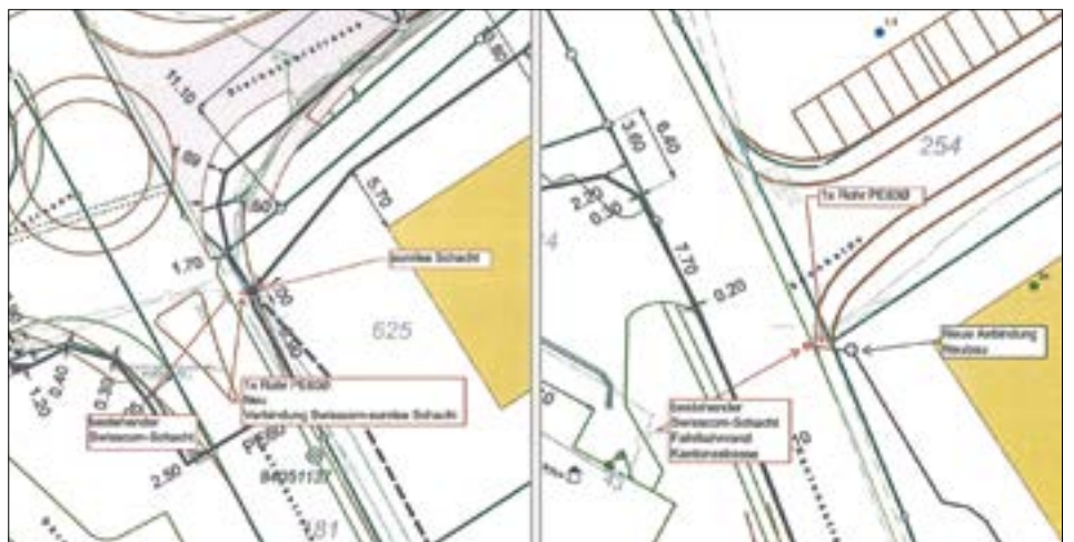
Übersichtplan zu den baulichen Werkleitungsmassnahmen.