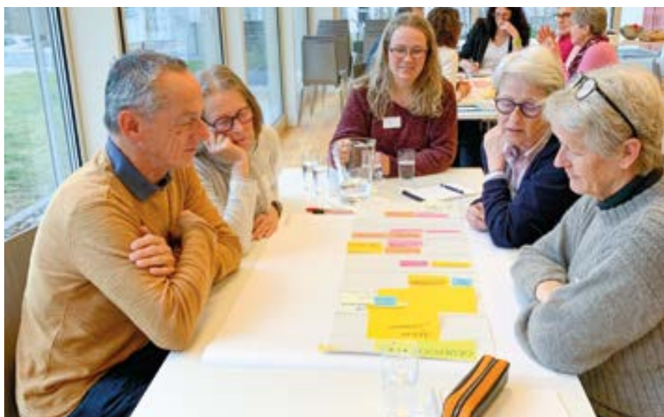
Der Anlass bot Gelegenheit, sich über zentrale Fragen der mobilen Altersarbeit auszutauschen.