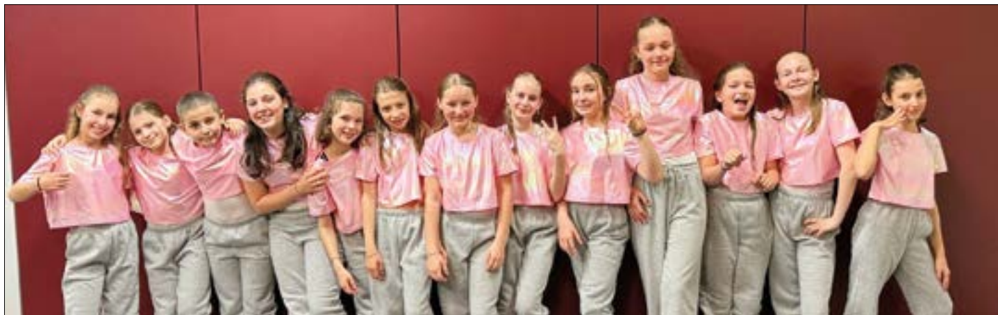
Auch Schülerinnen der Schule Geuensee nahmen heuer am School Dance Award im KKL Luzern teil.

13 Mädchen aus dem freiwilligen Schulsport standen beim School Dance Award Ende März 2025 als «Dancing Bubbles» auf der grossen Bühne im KKL in Luzern – und das mit ordentlich Nervosität im Gepäck.