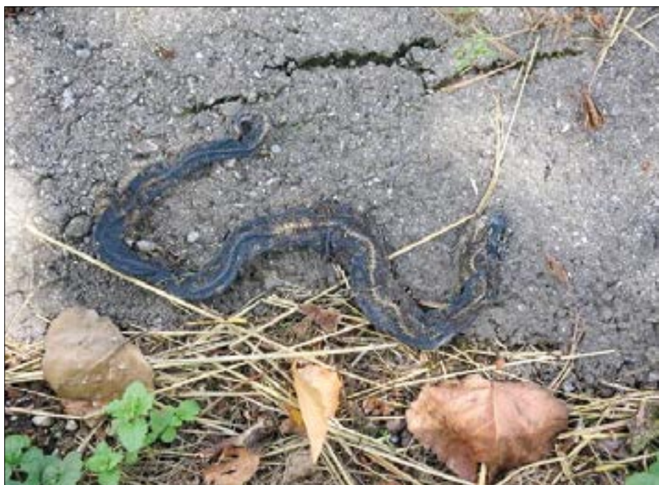
Ringelnattern wurden in der Schilf-Retensionsanlage gesichtet.