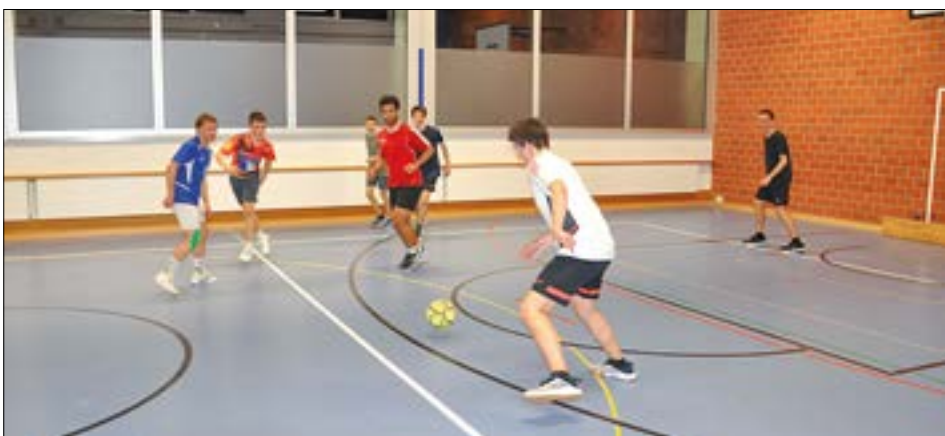
Die Trainings finden – ausserhalb der Ferien – jeden Donnerstag statt.

Die Teilnahme steht Personen im Alter von 15 bis 30 Jahren offen. Es fällt keine Teilnahmegebühr an, sodass auch keine Jahresbeiträge zu