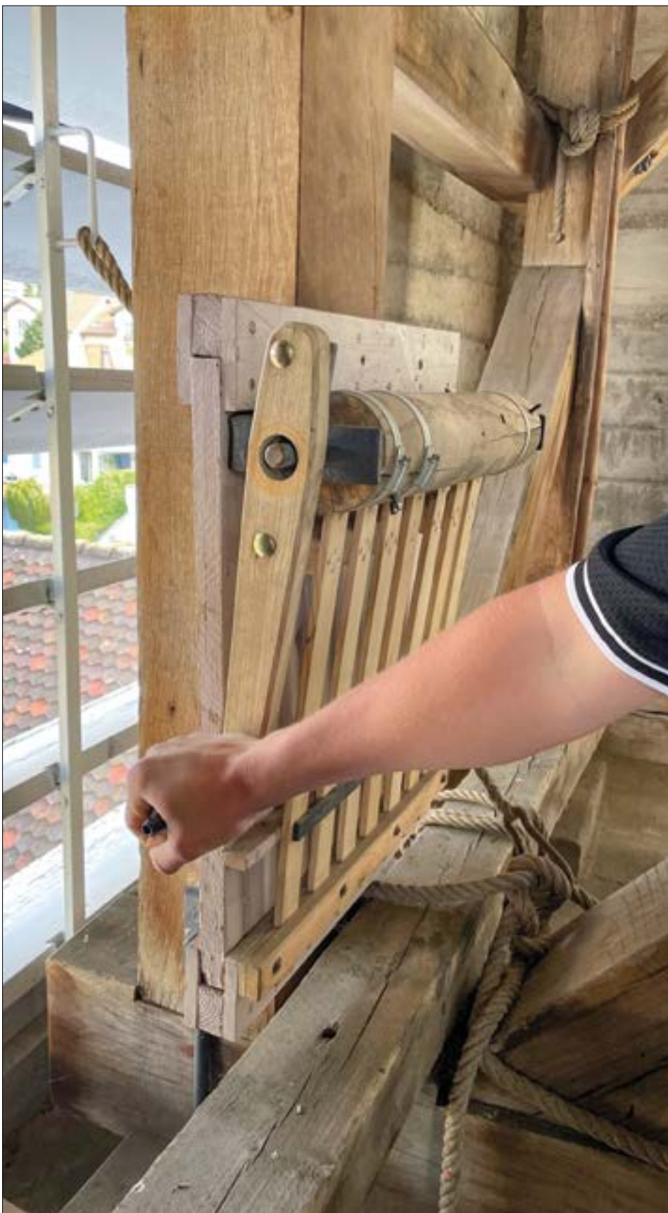
Festinstallierte Rätsche in der Glockenstube unseres Kirchturms wird von einem Jublaleiter bedient.

Karfreitag, 18. April, 9.45–10 Uhr zum Familienkreuz; 14.45–15 Uhr zur Karfreitagsfeier und am Karsamstag, 19. April, 20.45–21 Uhr zur Feier der Osternacht.