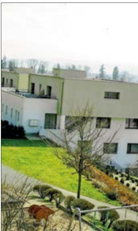
Die Redaktion des «Geuensehers» erhielt diese beiden Fotos von Caecilia Marbach aus Sursee. Sie wohnte früher an der Grünastrasse in Geuensee und zeigt mit ihrem Fotovergleich, wie sich das Ortsbild beim Strassacher über die Jahre verändert hat. Die alte Aufnahme links stammt aus dem Jahr 2001.