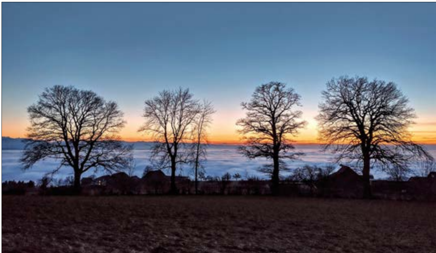
Malerische Abendstimmung oberhalb Hunzikon.