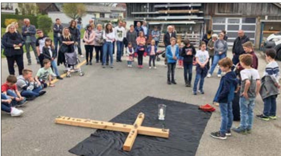
Die dritte Station im Mitteldorf: Jesus wird gekreuzigt.