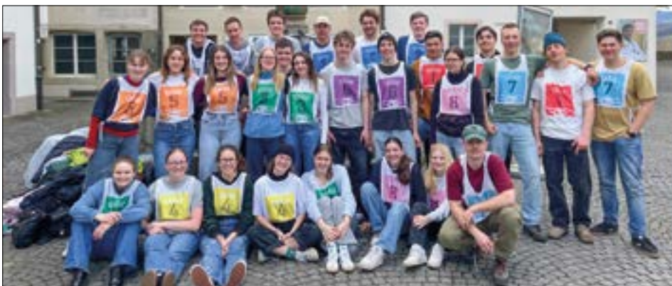
Die Jubla Geuensee freut sich auf den Grossanlass in Wettingen.

Die Schar reist ins Freizeitzentrum Tägi Wettingen, wo das Zeltlager stattfindet. Drei Tage lang erwartet die Teilnehmenden spannende Spiele, actiongeladene Wettkämpfe und geheimnisvolle Missionen.