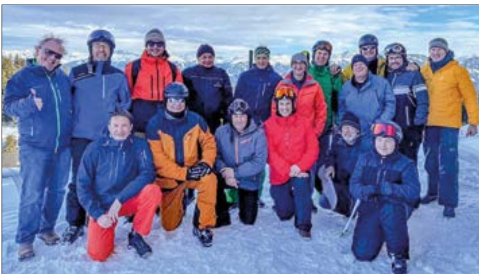
Sonnenschein und Neuschnee sorgten für gute Stimmung bei den Männerturnern.

Die Pisten waren wunderbar präpariert, und der Sonnenschein trug zur guten Stimmung bei. Am Sonntagmorgen waren die Geuenseer die Ersten auf den Pisten und genossen das leise Surren der Skis auf den unberührten, frisch präparierten Pisten. Die Glücksgefühle waren allgegenwärtig, und die Freude über das gelungene Wochenende war gross.