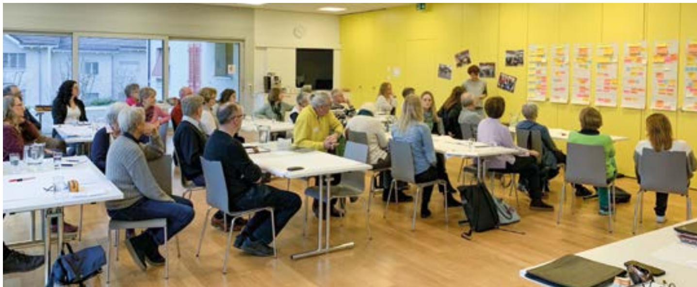
Mit vielen interessierten Teilnehmenden fand der Auftakt-Workshop im Begegnungszentrum Geuensee statt.

Die Gemeinden Büron, Eich, Geuensee, Knutwil, Mauensee, Schenkon und Sempach starteten am 13. Februar 2025 mit einem Auftakt-Workshop in das Projekt «Mobile Altersarbeit».