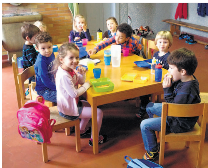
Der Kindertreff ist ein spannender Hort für Kinder unterschiedlichen Alters.

Die Spielgruppe orientiert sich an den Bedürfnissen der Kinder und stellt eine konstante Gruppe von gleichaltrigen Kindern dar, welche sich je nach Alter ein- bis zweimal in der Woche zum freien Spiel