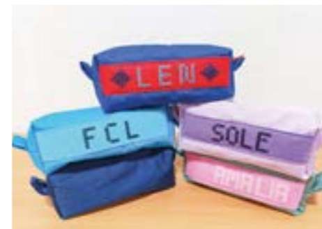
Im Fach «Textiles und technisches Gestalten» entstanden tolle Etuis.