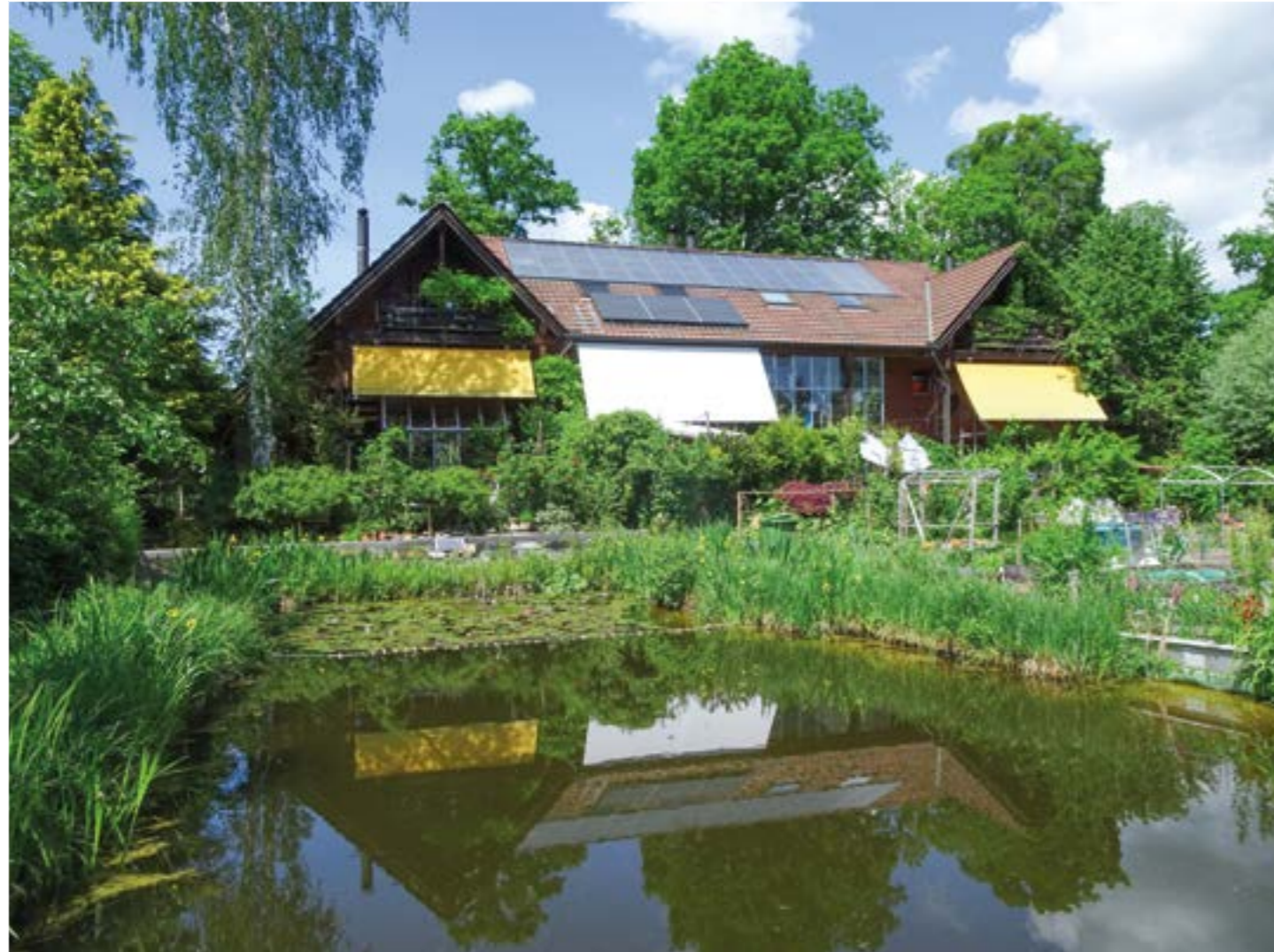
Nicht nur der Gemeinschaftssinn hat im Sonnenhof viel Platz, sondern auch die Natur.