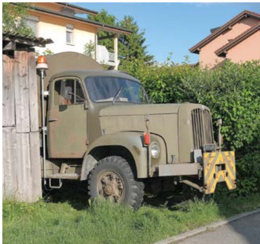
Steckbrief: Ehemaliges Mehrzweckfahrzeug der Schweizer Armee (Saurer, Arbon); Baujahr 1966; Gewicht 7 Tonnen; Kilometerstand 86'000.

Entdeckt im Unterdorf bei einem Haus, das den Namen «Friedheim» trägt.