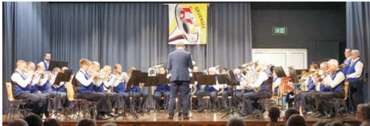
Die Musikgesellschaft Geuensee sorgt nicht nur auf der Bühne für gute Unterhaltung.