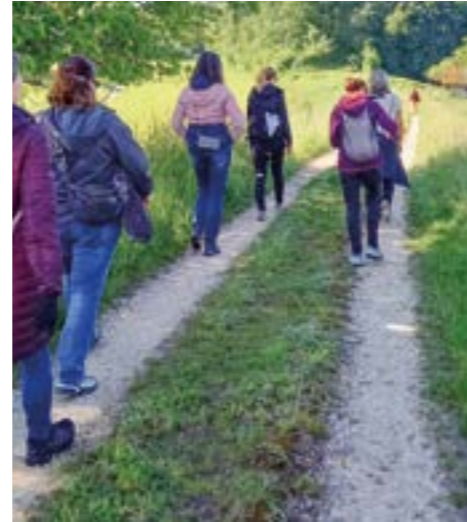
Mit vielfältigen Aktivitäten sammelte die Geuenseer Bevölkerung auch in diesem Jahr viele Bewegungsminuten.