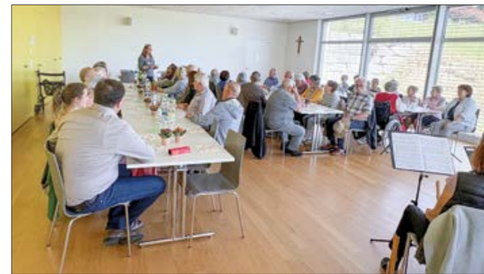
Die Jubilarenfeier fand im Begegnungszentrum St. Niklaus statt.

Für die musikalische Umrahmung sorgte ein Blockflöten-Ensemble, das mit seinen Darbietungen zu einer stimmungsvollen Atmosphäre beitrug. Bei Kaffee und feinem Dessert blieb zudem viel Zeit für schöne Gespräche und geselliges