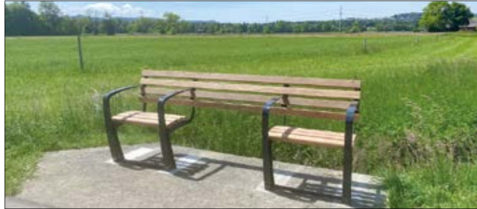
Die neue Sitzbank im Gebiet Allmend fördert mit ihrer Konstruktionsweise Inklusion.

Seit einigen Jahren lebt die herausragende Para-Athletin Catherine Debrunner in Geuensee. Catherine hat mit ihren internationalen Erfolgen – darunter Weltmeistertitel und Paralympics-Medaillen – nicht nur im Sport, sondern auch als Vorbild für Engagement, Durchhaltevermögen und Lebensfreude weit über die Gemeindegrenzen hinaus Anerkennung gefunden. Sie zeigt eindrücklich, wie man mit Entschlossenheit, Disziplin und einem positiven Mindset Herausforderungen meistert.