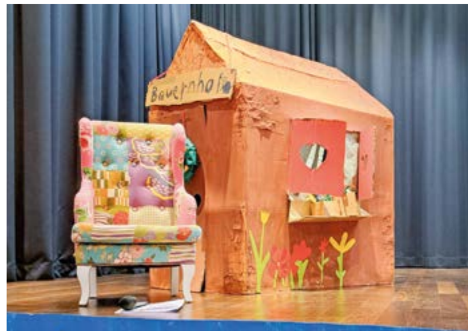
Das Räuberhaus auf der Bühne.