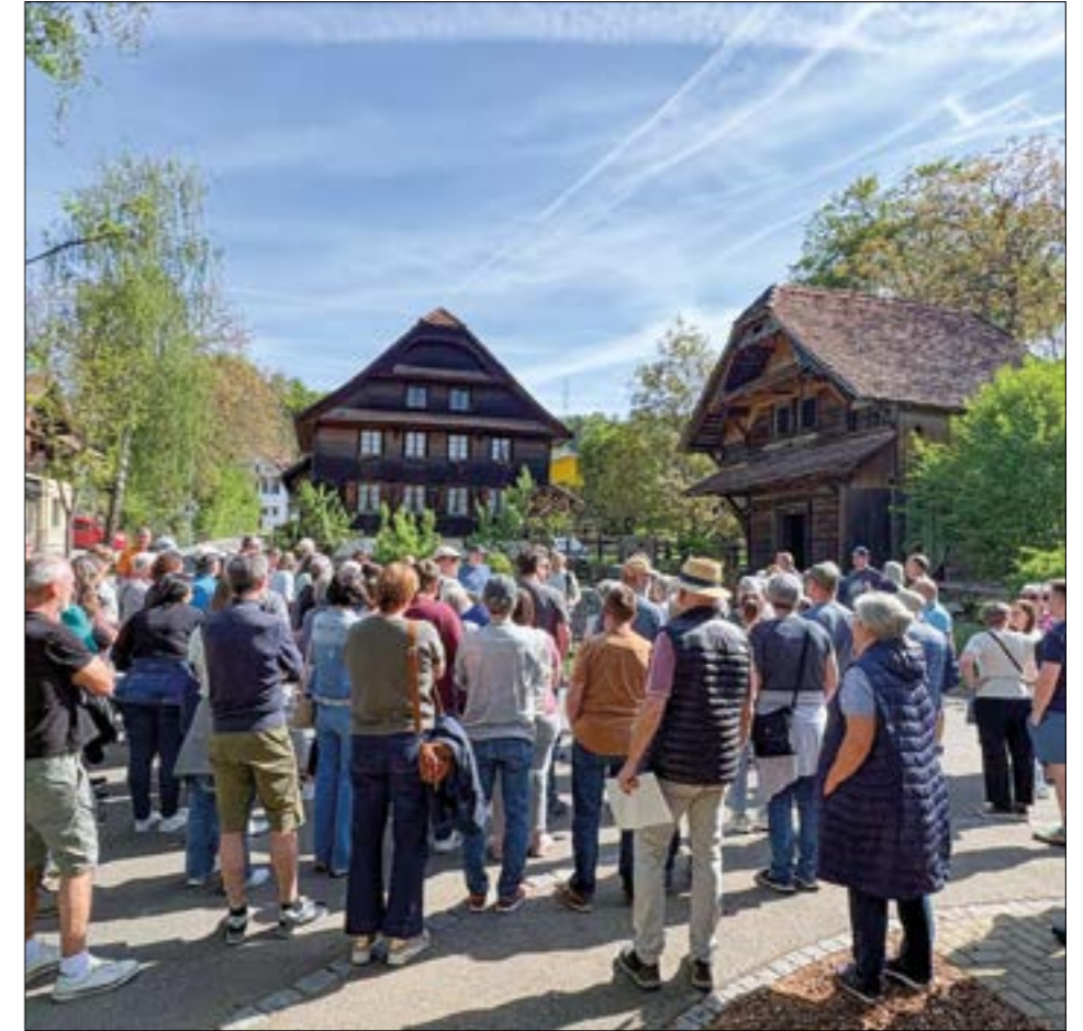
Die Bevölkerung zeigte grosses Interesse an der Dorfgeschichte von Geuensee.