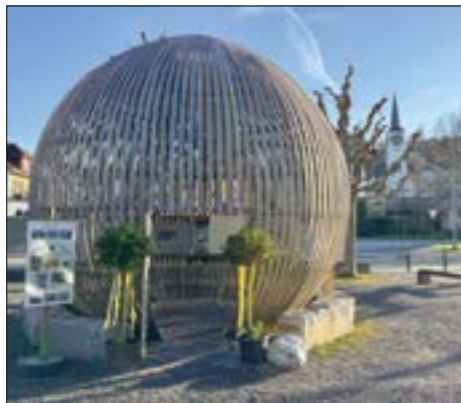
Das Globhuus beim alten Schulhaus.

Seit Ostern ist die Ausstellung «450 Jahre Kapelle St. Nikolaus – ein spiritueller Ort im Wandel der Zeit» im Globhuus beim alten Schulhaus zugänglich. Zehn Bildtafeln erzählen abwechslungsreich und übersichtlich die Geschichte dieser besonderen Wegkapelle von ihren Anfängen bis heute.