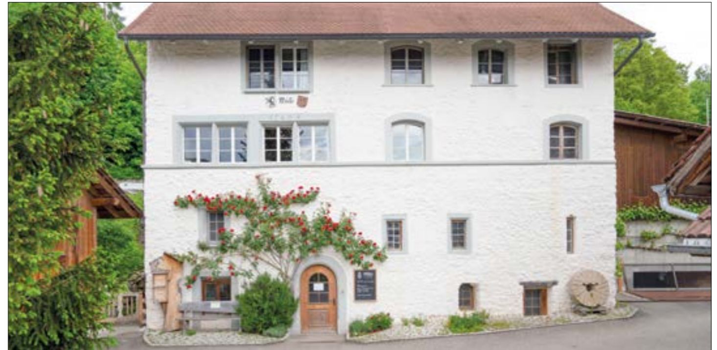
Für die historische Bio-Mühle wird eine neue Pächterschaft gesucht.