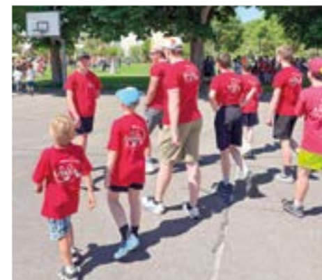
Die Jubla Geuensee in Sursee.

In Sursee angekommen, wurde zuerst das passende Outfit vorbereitet: Mit farbigen Federn schmückten sich die Kinder und Leitenden als fröhliche Papageien. So passte unsere Gruppe perfekt zum diesjährigen Motto und sorgte schon zu Beginn für gute Stimmung.