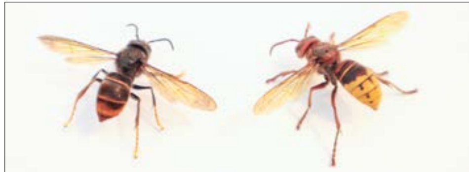
Die Asiatische Hornisse.