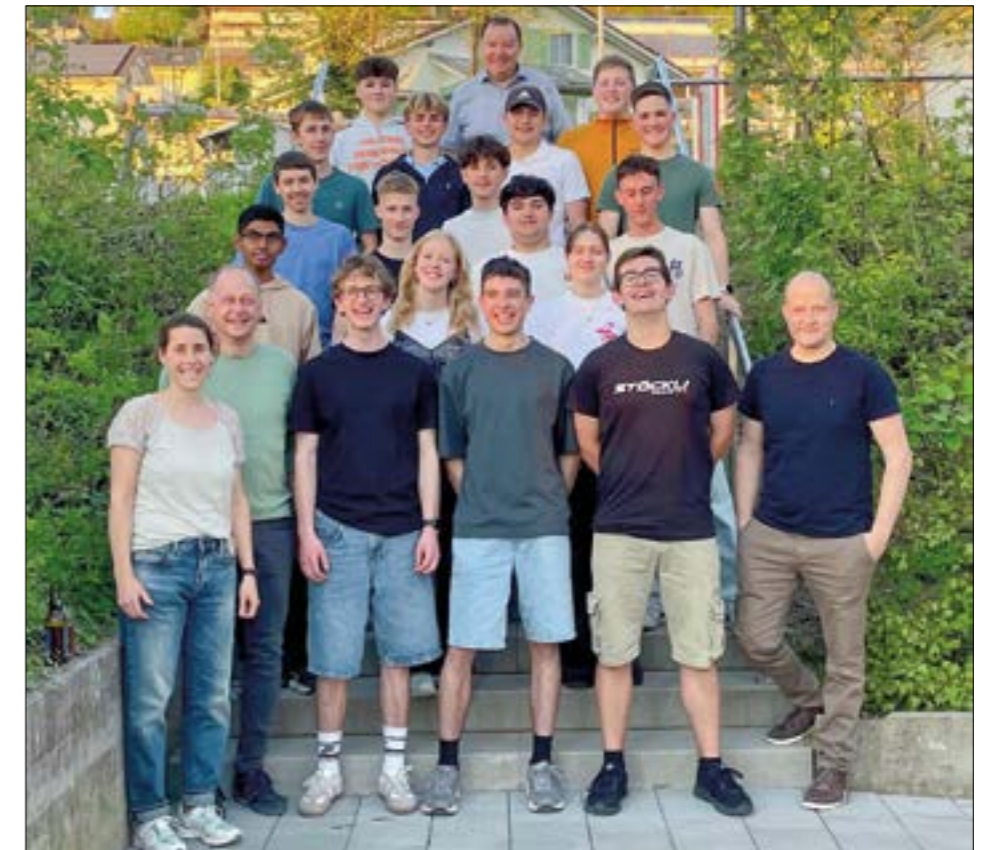
Die Jungbürgerinnen und Jungbürger trafen sich nach dem Bowling bei der Chömhütte.