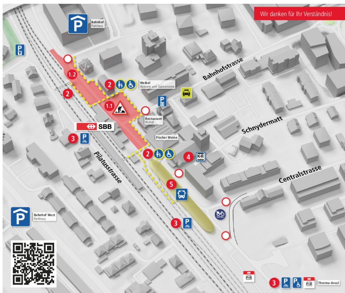
Ausschnitt Baustelleninformationsschreiben Phase 15. Dezember 2024 bis anfangs 2026

Die Abwicklung des öffentlichen Verkehrs erfolgt über den neuen Bushof, der für den motorisierten Individualverkehr (MIV) komplett gesperrt ist.